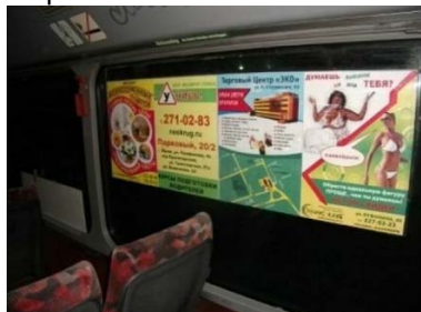
Автобусы Формат А3